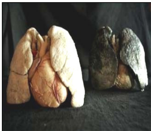
Pulmones sanos a la izquierda. Pulmones de fumador a la derecha. ¡No hay gran sorpresa!

La mitad de los adultos que fuman (millones de personas) han dejado de fumar, ¡usted también puede!